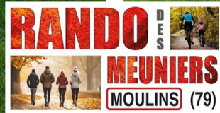
Des paysages magnifiques