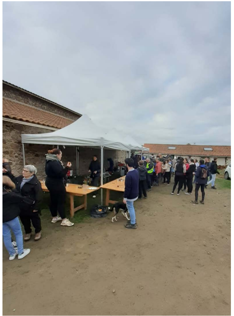
Un des ravitos, lieu stratégique aussi !