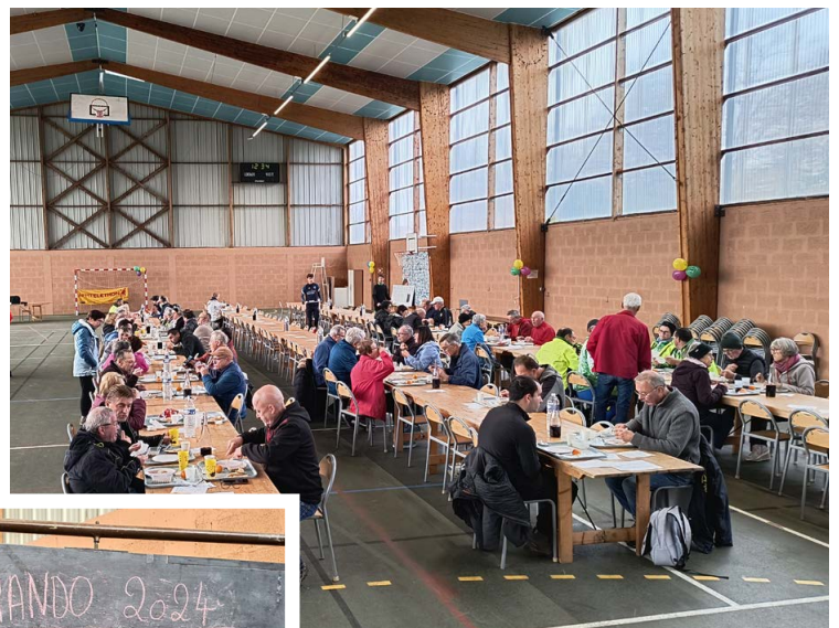
Salle omnisport comble