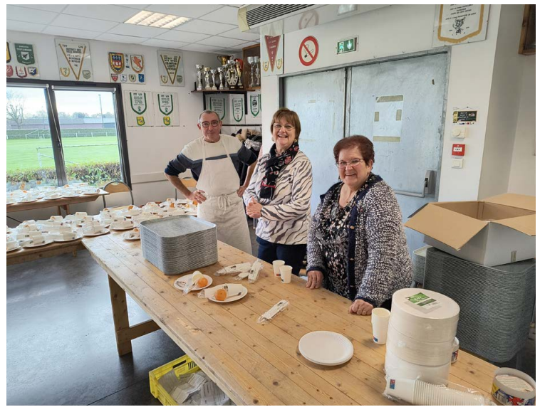
L'équipe «Repas» prépare et agence pour gérer 600 repas en 2 heures !